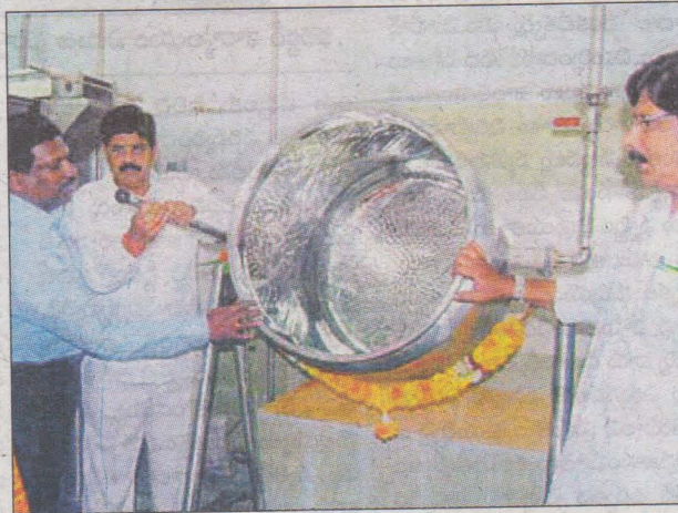
ఆధునిక వంటపాత్రను పరిశీలిస్తున్న మంత్రి ఆనం, కలెక్టర్, ఎమ్మెల్యే